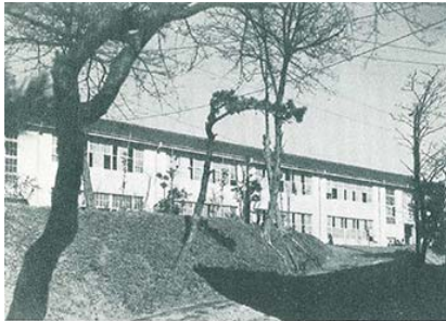
再建された附属第一中学校の校舎