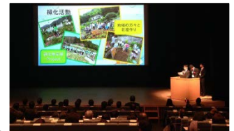
※写真はすべてイメージ

京葉銀行は企業が持つ知見やノウハウを活かしアドバイスするなど学生を支援していきます。