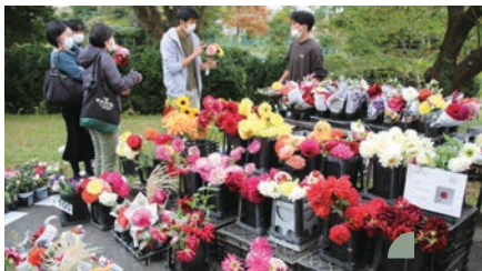
2022年戸定祭 Tojo Festival (2022)

大学院園芸学研究所は、自然科学研究科を改組し、園芸とランドスケープを柱としたわが国唯一の専門大学院として、2007(平成19)年に設置された。現在は、そのとき設置された園芸