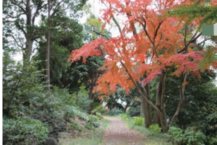
紅葉とロックガーデン Autumn leaves and rock garden

科学コース、ランドスケープ学コースに、2023(令和5)年に設置された国際環境園芸学コースを加えた3コースが設けられている。園芸学研究科は、総合大学としての千葉大学の特性を生かしたトランスディシプリナリーなアプローチにより、園芸学部の「理論と実践」という伝統を加えた「問題に対する理論的な検討とあらゆる科学的成果を用いた実践を基盤にして、国際性を持って地球規模の視点から社会の問題解決に取り組むことのできる、高度な知識と創造性を持った職業人を育成する」という理念に基づいた教育を行っている。