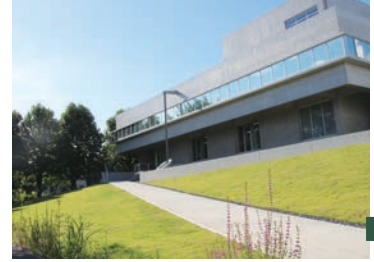
アカデミック・リンク松戸(2019年竣工) Academic Link Matsudo (completed in 2019)

The Faculty of Horticulture is the only one in Japan specializing in teaching horticulture with “food and greenery” as keywords in education and research, and consists of four departments: the Department of Horticulture, the Department of Applied Biological Chemistry, the Department of Environmental Sciences and Landscape Architecture, and the Department of Resources and Environmental Economics. Inheriting an academic culture that emphasizes theory and practice, a tradition that dates back to the days of vocational schools, the department aims to “provide students with a broad and deep education, the ability to make comprehensive judgments, and a rich sense of humanity”, so that they can respond theoretically and practically from a broad perspective to issues such as the production