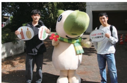
千葉大学マスコットキャラクター「マツ」と学生 Chiba University mascot character "Matsu" with students

最後に最新のトピックスとして、2023年に設置された宇宙園芸研究センターを挙げたい。同センターは人類が宇宙で暮らすための食料生産システムを構築するために、学内外の部局や研究機関と連携し、宇宙居住の実現、それを担う若手人材の育成を目指す。これによって、学部・研究科・研究院が、地球社会での課題解決や各種関連産業の振興にさらに貢献していくことが期待される。