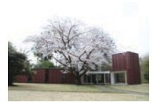
イギリス風景式庭園と洗心倶楽部(2016年竣工) English landscape garden and Senshin Club (completed in 2016)