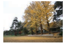
イチョウと100周年記念戸定ヶ丘ホール(2011年竣工) Ginkgo and 100th Anniversary Tojogaoka Hall (completed in 2011)