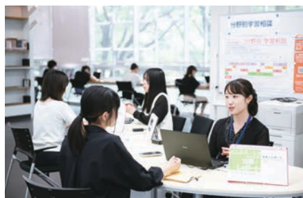
学習相談デスク Study consultation desk

さらに、2011年4月のアカデミック・リンク・センターの設置と、増改築に伴う本館(2012年3月)、松戸分館(2019年11月)のリニューアルを機に、学習空間・コンテンツ・人的支援の3つの機能による「考える学生の創造」を目指した教育・学習支援を開始した。2017年度には対象を大学院生や若手研究者まで拡大し、センター教員・図書館職員・Student Assistantの学生が教職学協働で、対面とオンラインによる学習・研究支援を展開している。加えて2015年7月に教育関係共同利用拠点の認定を受けて教育・学修支援専門職養成プログラムを開始、2020年度には学習・研究支援のポータルサイトを公開するなど、本学のみならず他大学にも広く開かれた支援の提供を行っている。