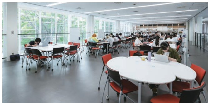
本館N棟2階コミュニケーションエリア Main building communication area (N building 2nd floor)