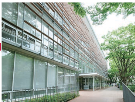
附属図書館本館 University Library Main Building

Digitization has significantly impacted the dissemination of research output from universities. In 2005, we launched the Chiba University Repository for Access to Outcomes from Research: CURATOR, the first institutional repository among Japanese universities. In addition, we made digitized academic resources owned by Chiba University widely available on the web with International Image Interoperability Framework (IIIF) technol-