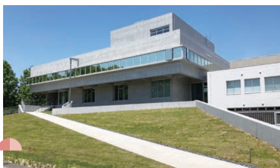
アカデミック・リンク松戸 Academic Link Matsudo

Our activities are not intended only for Chiba University users. The Academic Link Professional Staff Development Program for Educational and Learning Support, which was launched in July 2015 after having been selected as a Joint Usage / Education Center by the MEXT, has enjoyed the participation of staff members from various universities. The learning and research support portal sites, designed originally for Chiba users in FY2020, are also open to the public.